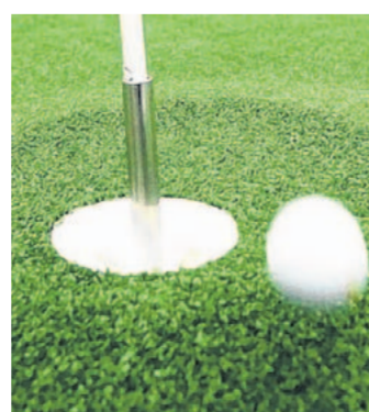
Golf lernen per Handy

In Japan lernen immer mehr Menschen in der U-Bahn Golfspielen. Wie das? Ganz einfach: Mit dem Handy. In der Mobilfunkhochburg erfreuen sich nämlich virtuelle Golfkurse auf speziellen Mobilfunkseiten wachsender Beliebtheit, wie die japanische Wirtschaftszeitung „Nikkei“ berichtet. Für eine Monatsgebühr von umgerechnet gerade einmal zwei