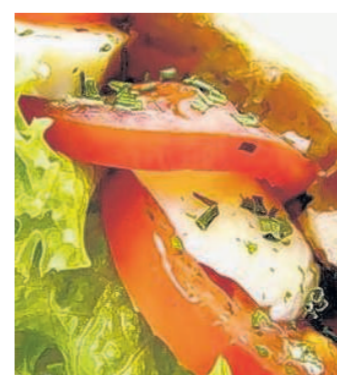
Panini mit Politikernamen.

In Italien, dem Land der politischen Instabilität , löst man seit jeher Probleme lieber kulinarisch. Letzter Schrei in Rom ist das Politiker-Brötchen. So bietet etwa ein Lokal in der Nähe des Petersdoms alle möglichen „Panini“ an, die den Vornamen von Politikern tragen. Da gibt es etwa die mit Mortadella und Käse belegten Semmeln „Romano“, benannt nach dem scheidenden Ministerpräsidenten Romano Prodi. „Walter“, nach dem neuen Spitzenkandidaten der Linken Walter Veltroni getauft,