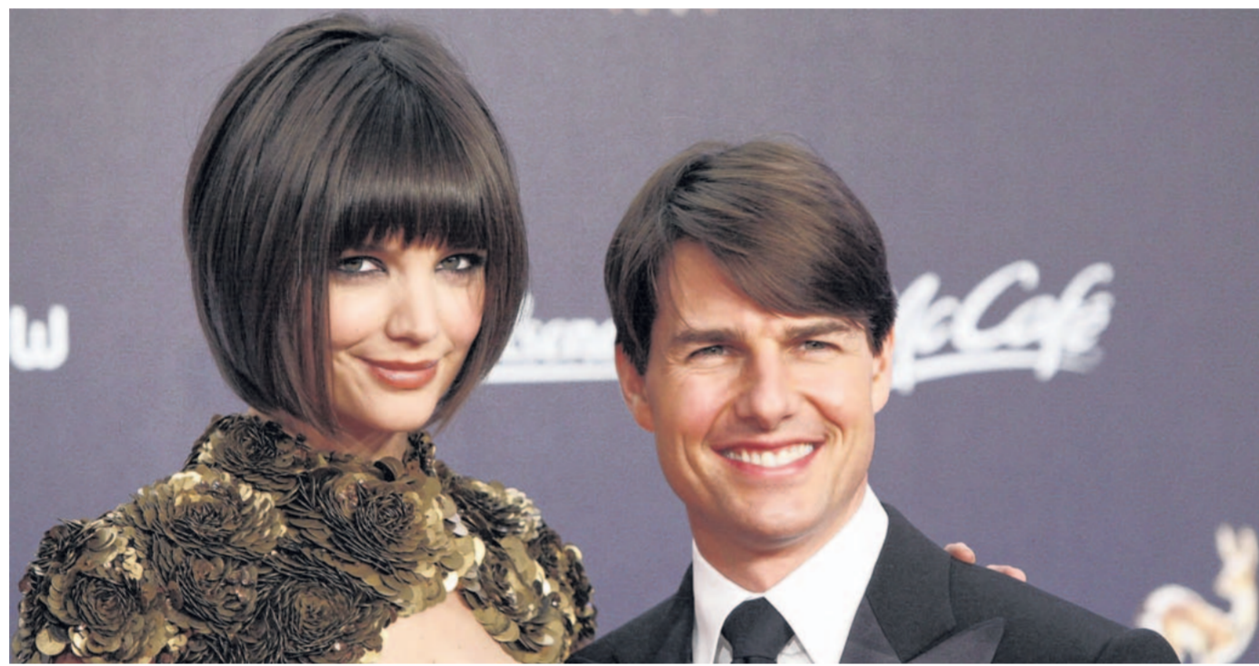
Das ist der Haarschnitt von Katie Holmes (Ehefrau von Tom Cruise), den so viele Frauen haben wollen.